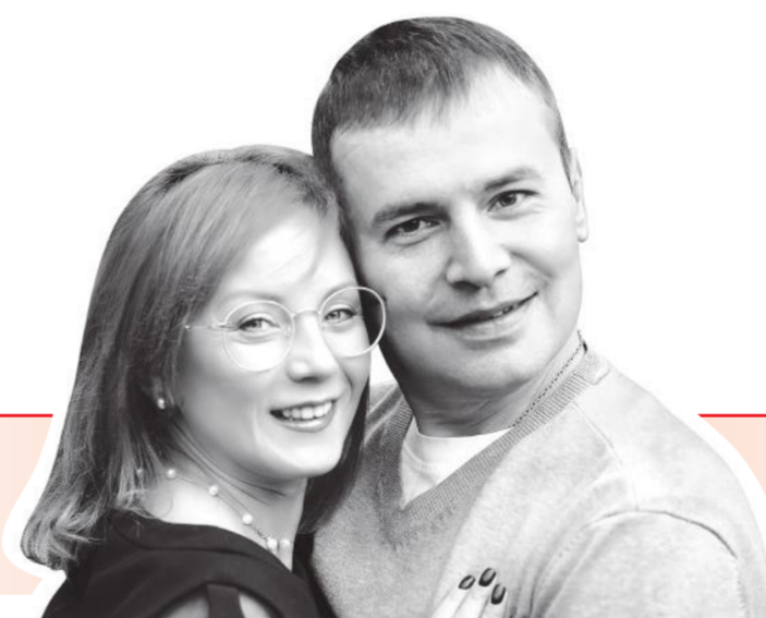
СЕМЬЯ, РОДИТЕЛИ ЧЕТЫРЕХ ДЕТЕЙ